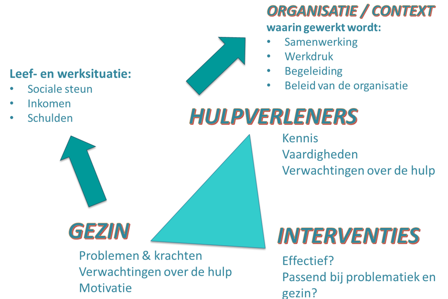
Figuur 1: Conceptueel model beïnvloedende factoren

Op 7 juni as. worden deze bevindingen in de Stuurgroep van de Structuur Plus groepen besproken.