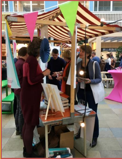
Foto-impresie van de dag

ACADEMISCHE WERKPLAATS TRANSFORMATIE JEUGD FRIESLAND