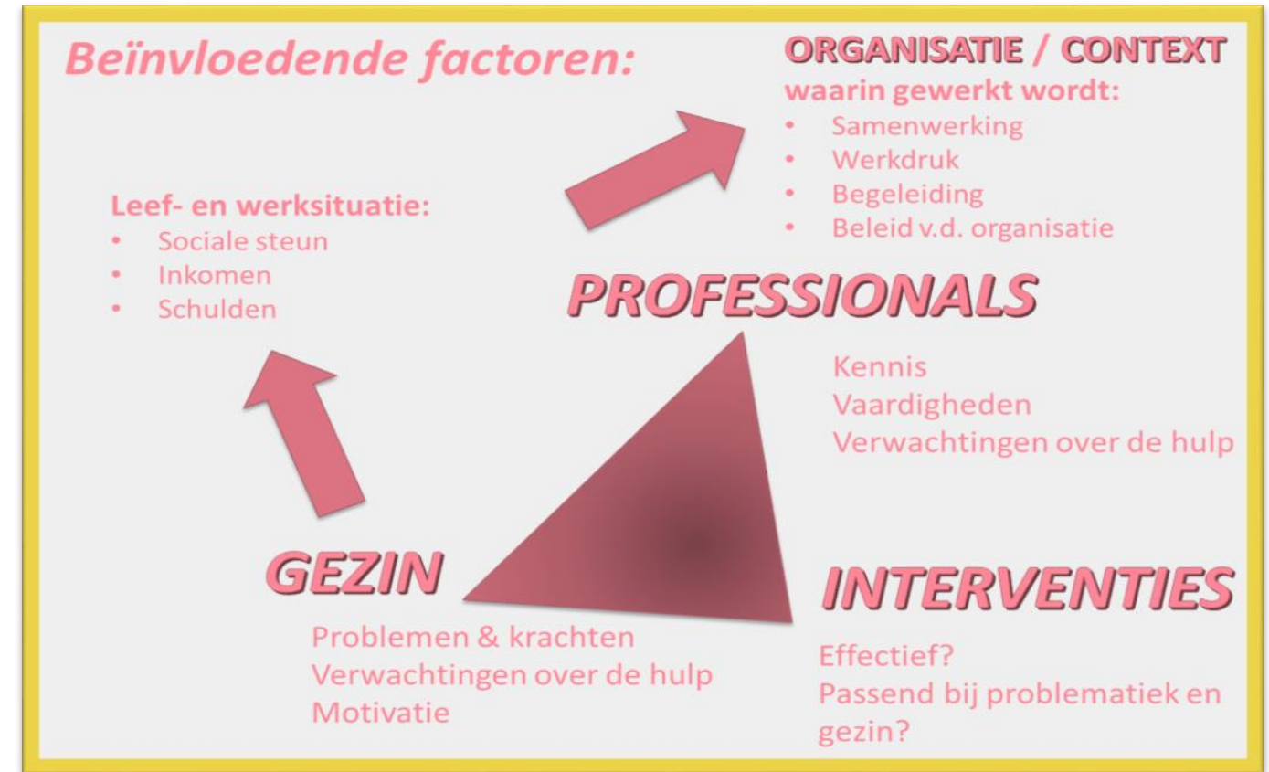
Figuur 1: Conceptueel model beïnvloedende factoren